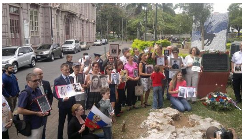
«Бессмертный полк» в Парке Морасан. “Regimiento inmortal” en el Parque Morazán.

Праздничный цикл открылся в главной аудитории Коллегии журналистов 4-го мая. В этот вечер там состоялось торжественное собрание, на котором присутствовал посол Российской Федерации в Коста-Рике А.К. Догадин, дипломатические представители из других стран, представители академических и деловых кругов Коста-Рики, русские соотечественники, коста-риканские журналисты, их родственники и друзья. Сио-