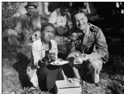
Американский офицер и старейшина племени Тайнуи

Американское вторжение пошло на спад в 1943 году. Для части новозеландцев уход молодых американцев стал приятным событием, для других это был повод для грусти и даже скорби, потому что много американских солдат погибло, особенно в битве за Тараву на островах Гилберта.