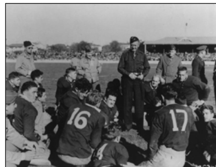
Матч по регби: морские пехотинцы США против сухопутных войск Новой Зеландии, 1943 год.

Американцы привезли и свои собственные развлечения. Спорт был очень популярен, так как он помог поднять моральный дух военных, улучшить физическую форму, и помимо этого спорт приносил радость и удовольствие зрителям. Игры бейсбольной и софтбошной лиг проходили в выходные дни, и в 1943 году в парке Атлетик в Веллингтоне собиралось до 20 000 зрителей. Также проводились турниры по боксу, а в оклендском парке Иден сухопутные войска играли против морских пехотинцев в американский футбол. В середине 1943 года в Веллингтоне одно из старых зданий было переоборудовано под спортивный зал и площадку для баскетбола и бадминтона. Неподалёку был открыт каток.