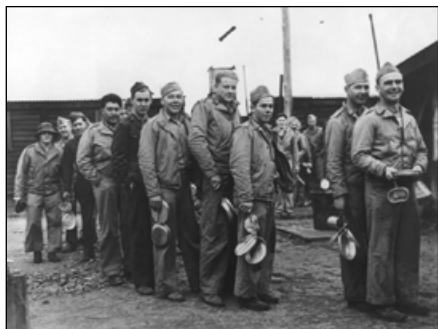
Очередь в столовую в лагере Маккей, 1943 год.

а потом ели в помещениях, оборудованных простыми деревянными столами. Еда была в изобилии и по возможности готовилась в американском стиле. Но местные продукты, особенно жирная баранина не всегда были привычны гостям и для приготовления, и для употребления в пищу. В больших лагерях были магазины, где можно было приобрести американские товары – сигареты и кока-колу. В лагерях делалось всё возможное, чтобы американцы чувствовали себя как дома среди новозеландских кустарников и песчаных дюн.