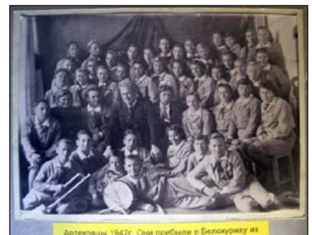
Артековцы в Белокурихе. Все испытания позади! Станица Нижне-Чирская. Трудовая вахта

Пароход «Правда» шлепал колесами по Волге. В Горьком — пересадка на пароход «Урицкий». Вот и Сталинград показался по курсу, абсолютно мирный город в конце июля 1941 года. Разве что на тракторном заводе теперь выпускали танки.