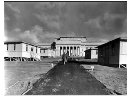
Лагерь Хейл в районе Окленда

На юге американские поселения, в основном, были сосредоточены на побережье Капити между западным берегом и горным хребтом Тараруа Ранге. Вокруг города Паикарики размещалось три больших лагеря: лагерь «Paekakariki», лагерь «Russell» (сейчас это территория парка «Queen Elizabeth»), а по другую сторону шоссе был лагерь «McKay». Рядом были лагеря поменьше — в Пауатахануи, Джаджфорд Вэлли и Титахи Бэй. В целом более 21 000 молодых людей могли быть размещены в этом регионе.