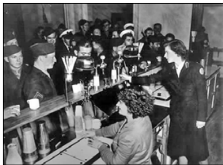
Американские военнослужащие в кафе-молочной

Присутствие в Новой Зеландии тысяч хорошо оплачиваемых американцев, составлявших часть огромной армии, привело к небольшому экономическому подъёму и повлияло на местные модели торговых отношений. Хорошо шли дела у химчисток, такси и кафе-молочных, а также на пристанях. Фермерам пришлось добиваться увеличения урожая капусты для солдат тихоокеанского фронта.