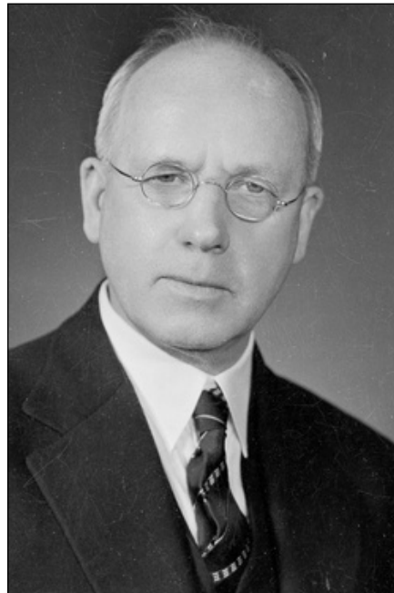
Премьер-министр Новой Зеландии Питер Фрейзер Лагерь

Таким образом, Новой Зеландии отводилась роль источника снабжения и перевалочного пункта при проведении в Тихом океане военных операций против Японии. Здесь же американские войска могли готовиться к новым битвам или восстанавливаться после сражений. Новая Зеландия также могла выращивать и поставлять овощи для обеспечения военных сил на передовой.