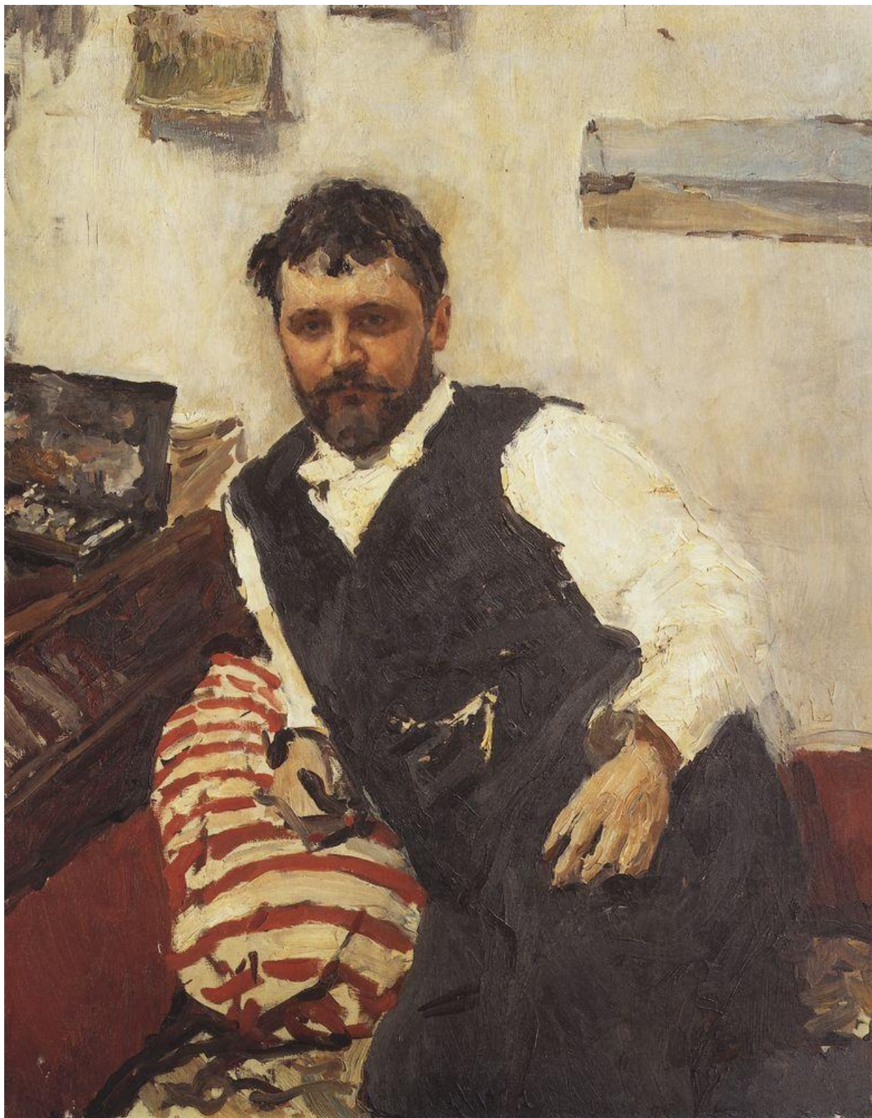
Портрет художника К. А. Коровина (1891) Холст, масло. 111,2 x 89.