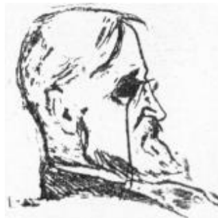
К. А. КОРОВИНЪ, 27 февраля 1937 года въ редакціи «Возрожденія», рисовалъ Иванъ Лу- нашъ. 3 минуты 2 секунды пра- вилъ самъ К. А. Коровинъ.

Семенов Ю. Добрый талант; Мандельштам Ю. Памяти К.А. Коровина; Тхоржевский. Коровин (ил); Лукаш И. К.А. Коровин скончался. Погас русский свет // Возрождение. 1939, 15 сент. (№4201). С. 5.