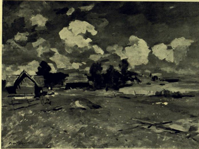
К. Коровин. Sommer auf dem Lande