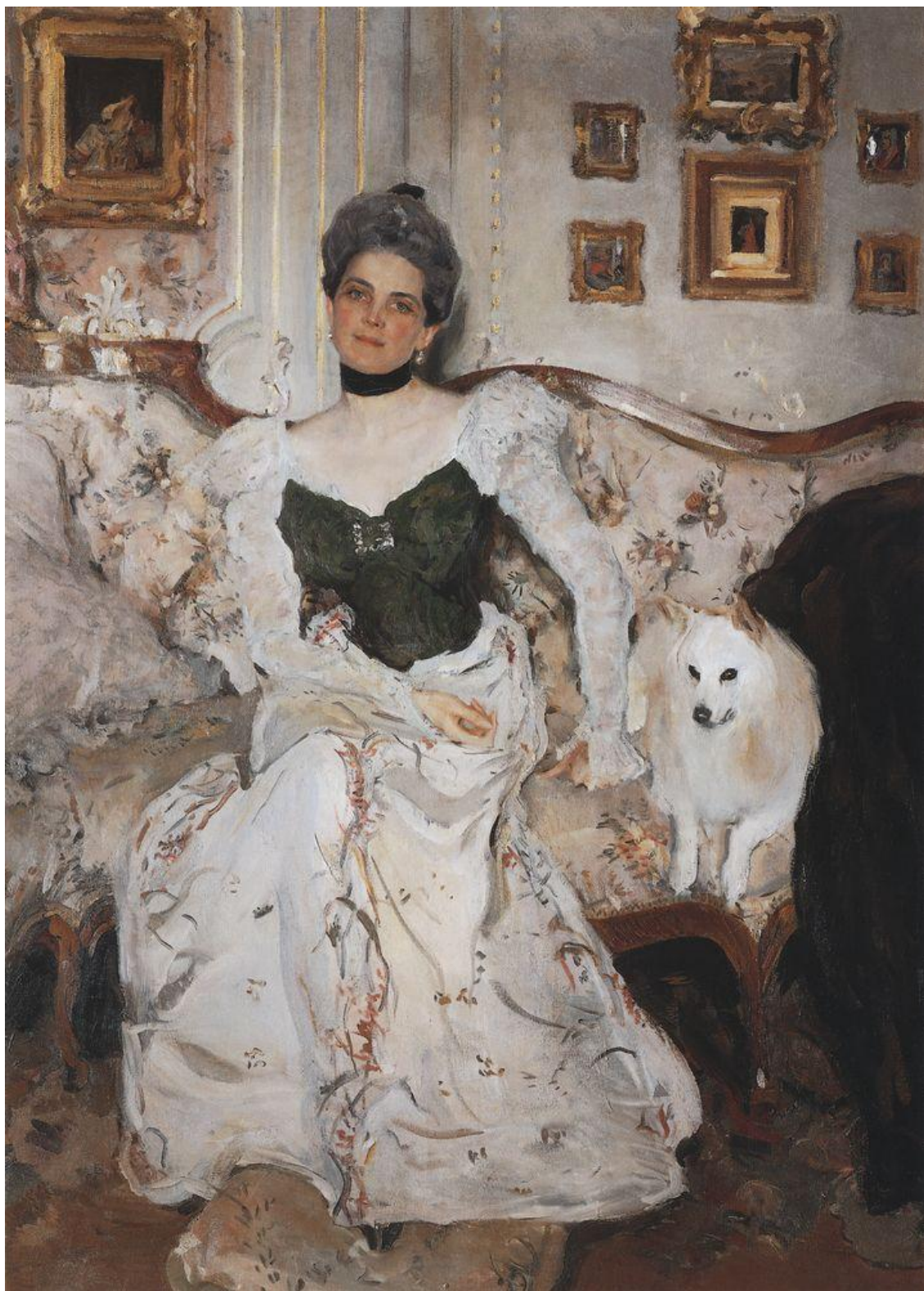
Серов В.А. Портрет княгини З. Юсуповой. 1902.